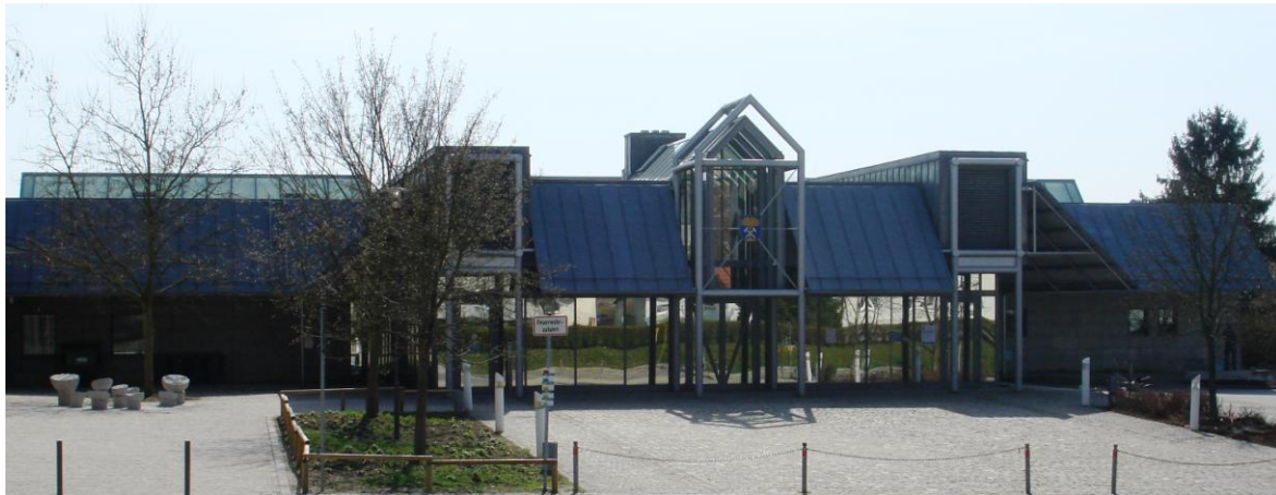
Sporthalle an der Hauptstraße